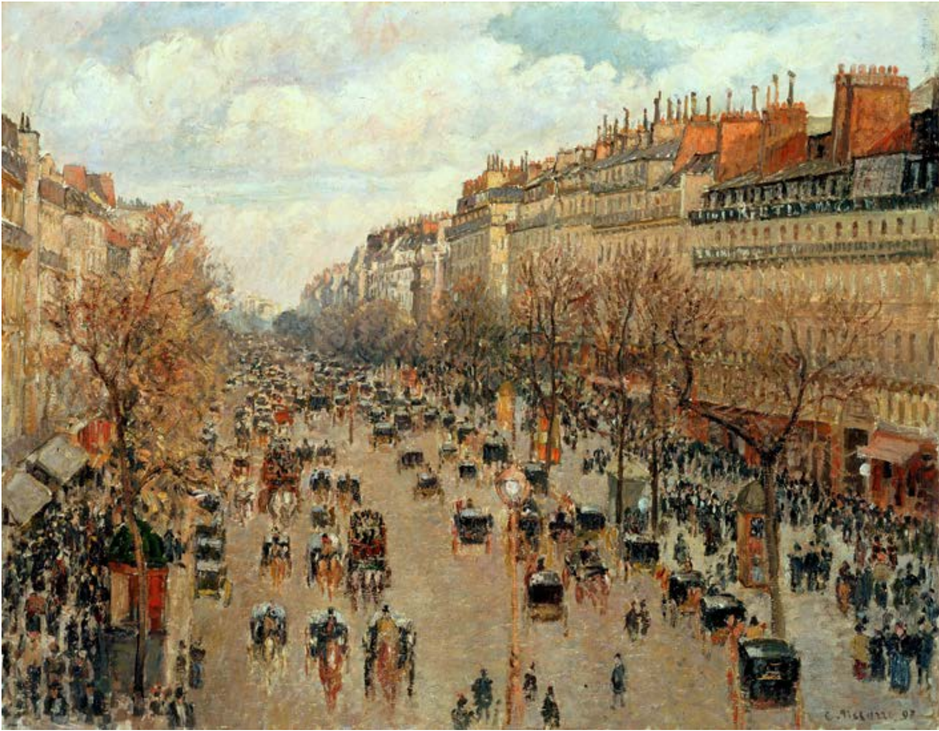
Camille Pissarro (1830-1903) "Boulevard Montmartre - Tarde soleada"