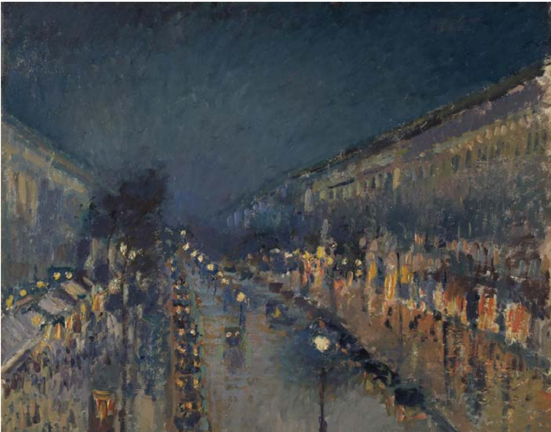
Camille Pissarro (1830-1903) "Boulevard Montmartre - De noche"